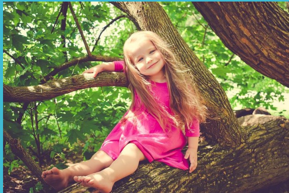
Imaginea nr.1 preluată de pe: https://pixabay.com/de/photos/m%C3%A4dchen-vater-portr%C3%A4t-augen-1641215/ ; Imaginea nr.2 preluată de pe: https://pixabay.com/de/photos/m%C3%A4dchen-kinder-kleinkind-jugend-3402351/